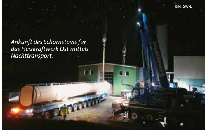
Ankunft des Schornsteins für das Heizkraftwerk Ost mittels Nachttransport.

eine Verbindungstrasse zwischen den Heizkraftwerken Ost, Süd 1 und Süd 2 gebaut.